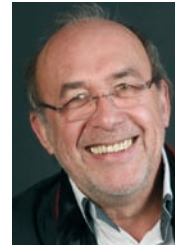
Rainer Lipczinsky Governor Distrikt 1841